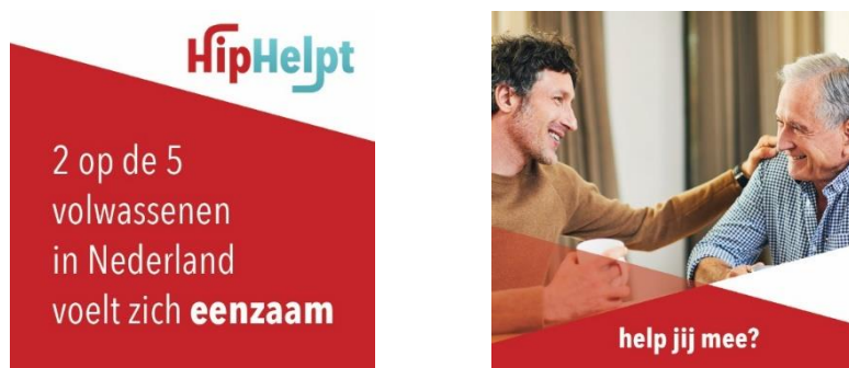
Figuur 1 Voorbeelden social mediacampagne HipHelpt met aandacht

HiP Helpt Veenendaal heeft in samenwerking met HiP Helpt Nederland een december-actie uitgevoerd rond het thema 'Eenzaamheid'. Er zijn flyers gestuurd naar de gebieden in Veenendaal waar de kans op schulden en/of eenzaamheid groter is (op basis van een landelijke database). Uit deze actie zijn veel nieuwe hulpbieders geworven. Daarnaast zijn er ook veel Veenendalers in het risico gebied attent gemaakt op het bestaan van HiP Helpt Veenendaal.