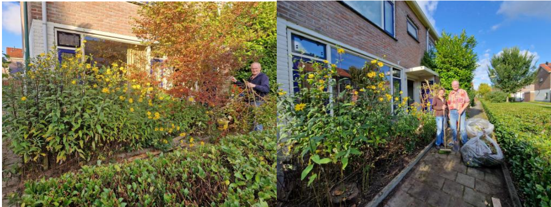
Foto: Voor en na een hulpactiviteit

De belangrijkste activiteiten zijn vanzelfsprekend het invullen van hulpvragen. Alle overige activiteiten zijn daaraan ondersteunend.